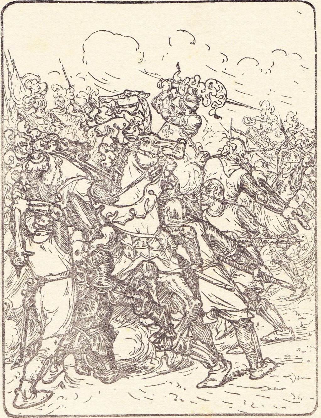
EEN VREESELIJKE BONS EN DE NEEF VAN FRANKRIJKS VORST STORT TER AARDE. Blz. 294.