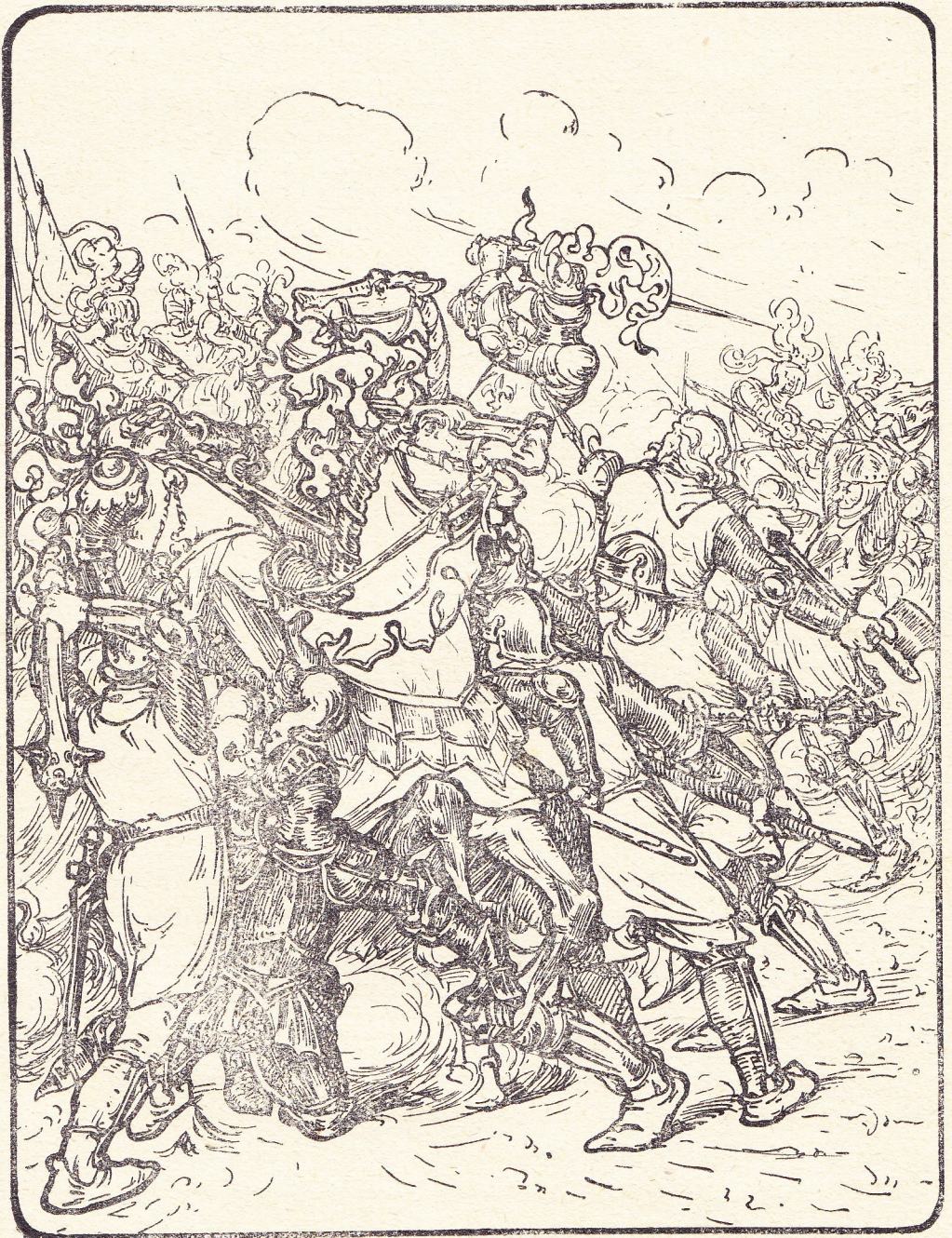
EEN VREESELIJKE BONS EN DE NEEF VAN FRANKRIJKS VORST STORT TER AARDE. Blz. 266

— Montjoie St. Denis! 't Is als eene jammerklacht die opstijgt.